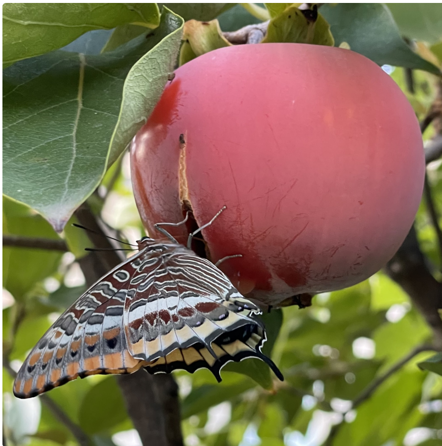
Papillon Jason ou Pacha à deux queues, ou Nymphale de l'arbousier ( Charaxes jasius , Linnaeus, 1767) sur un kaki (au jardin le 6 octobre 2023). Sa chenille se nourrit exclusivement de l'arbousier qui est sa plante hôte. À quelques mètres du plaqueminer (kakis) et des grenadiers, vous pourrez découvrir plusieurs arbousiers au jardin, en fleurs et fruits ces jours-ci. C'est le premier Jasius que nous observons dans le jardin, refuge de la Ligue de Protection des Oiseaux, où nous agissons en faveur de la biodiversité.